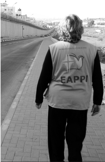
Separationsbarriere bei Al Ram, Ostjerusalem