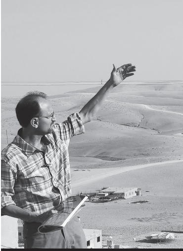
Firingzone 918 mit UN OHCHR